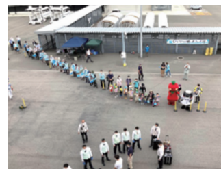
▲ 子どもたちのお出迎え