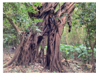
▲ 屋久島：ガジュマル公園