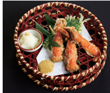
山本食堂▶ 「しゃくの天ぷら」

主に、やてる、唐揚げ、天ぷらなど頭も殻もそのまま調理され、独特の海の香りとほろ苦さは熊本のソウルフードとなっています。身と卵巣、みそ(肝臓)で作る塩辛、みそ漬けも「しゃくみそ」としてお酒の肴に重宝します。