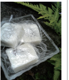
▲この日だけ発売される雪に見立てた雪餅

350年以上前の江戸時代初期、細川三斎(忠興)が妙見宮に参拝した折に、無病息災を祈って住民が八代市東町の三室山に氷室を作り、雪を貯えてこの日に献上したのが始まりといわれています。