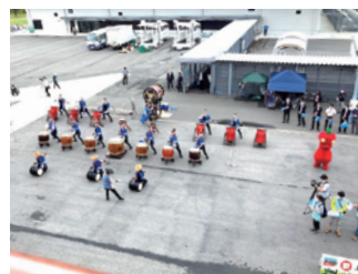
▲ 和太鼓の演奏でお見送り