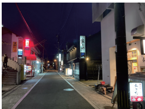
▲ 八代の夜の町に明かりが灯りました!まん延防止期間中は真っ暗で町が死んだようでした。

令和4年3月21日、全都道府県で「まん延防止等重点措置」が解除され、休業していた漱石グループ全店舗は3月22日より営業再開しました。