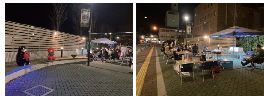
▲ まん延防止明けの3月26日に、商店街の「街活」メンバーで実験的にオープンバベキュー会をやってみました! とっても開放的でこれからの季節によさそうです!

熊本地震より工事中だった八代市役所も2月より新庁舎となり、市役所前から本町アーケードへの「こいこい通り」沿いに出来ているスペース「こいこい広場」の活用について、商店街の方達で検証イベントが行われました。街の活性化に有効活用出来そうです!