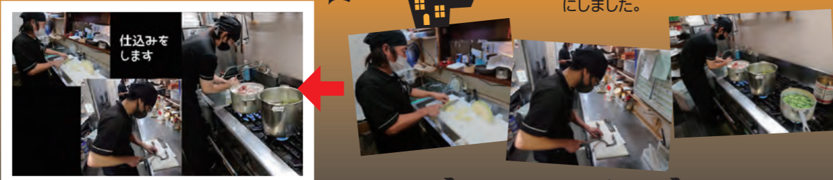
▲これは動画の方がいいかな~?と思っています。