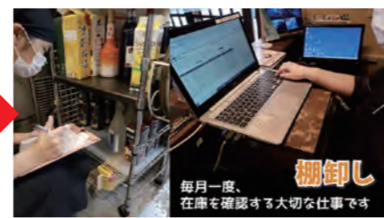
▲文字を入れて画像にし、スライドショーにしました。