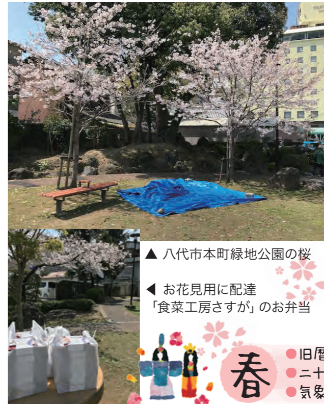
▲八代市本町緑地公園の桜 ◀お花見用に配達 「食菜工房さすが」のお弁当