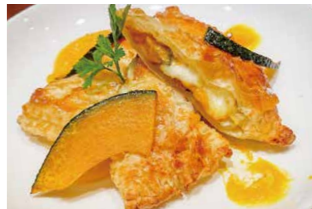
▲「そうせき八代店」の「カボチャのホットチーズパイ」